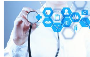
デジタルヘルス ロボティクス・AI