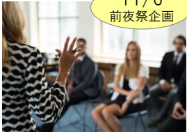
県内学生とシリコンバレー 起業家との交流会開催