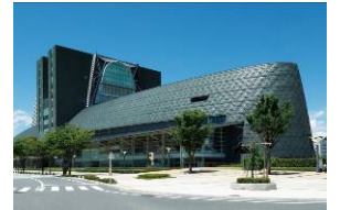
日米の医療機器ビジネスの 専門家が静岡に集結